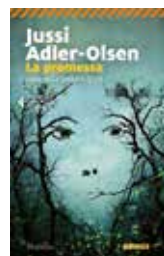
La promessa 978-88-297-0120-9 €12,00