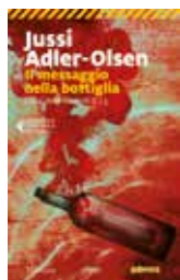
Il messaggio nella bottiglia 978-88-317-1268-2 €12,00