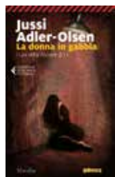
La donna in gabbia 978-88-317-3600-8 €12,00