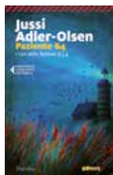
Paziente 64 978-88-317-8111-4 €12,00