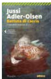
Battuta di caccia 978-88-317-1267-5 €12,00