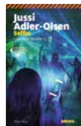
Selfie 978-88-297-0258-9 €12,00