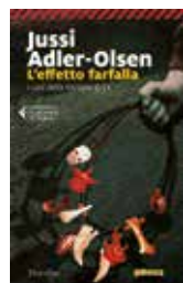
L'effetto farfalla 978-88-297-0042-4 €12,00