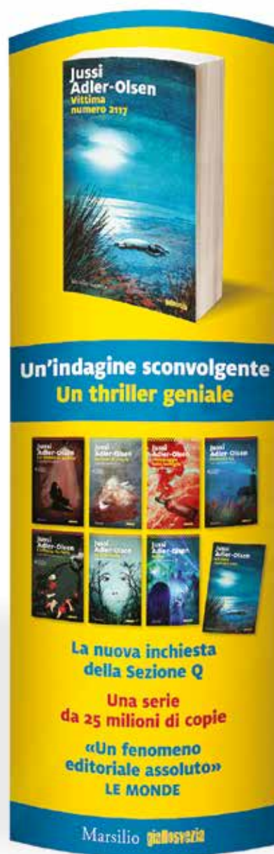
Kit Jussi Adler-Olsen Vittima numero 2117 cartello da terra bifacciale 48x137 cm, scomponibile e 2 locandine A3